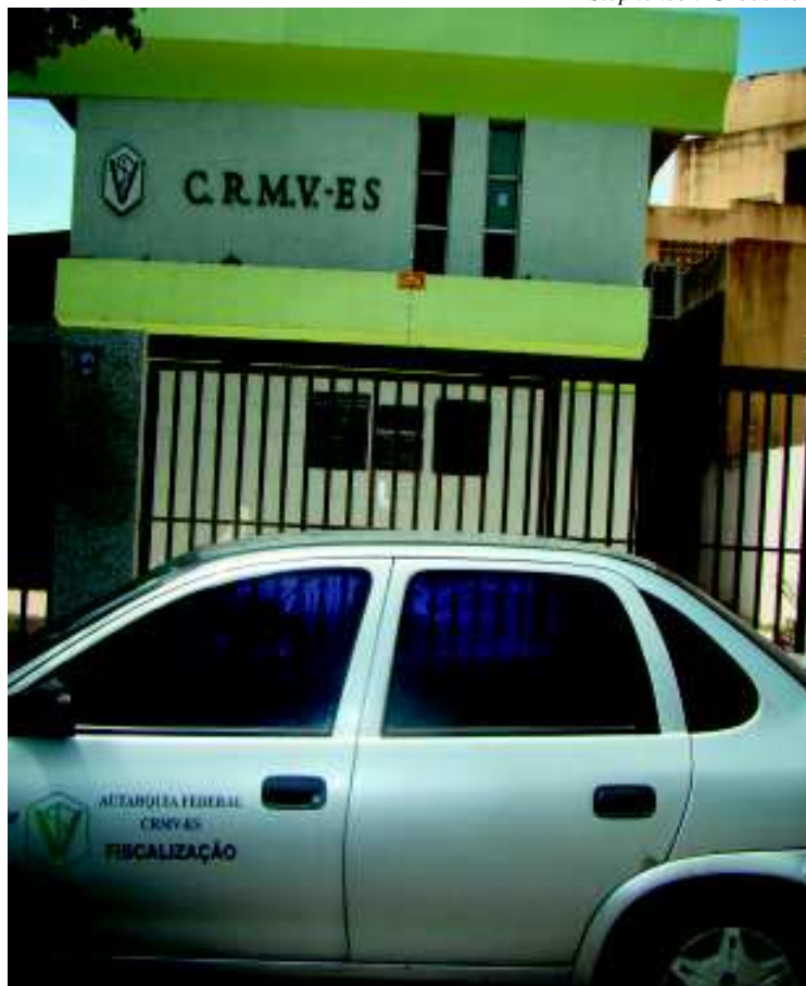
A sede do CRMV-ES fica na Rua Cyro Lima, 125, na Enseada do Suá, em Vitória (ES).

A defesa dos médicos veterinários e zootecnistas nos aspectos trabalhistas, quer seja salarial ou de condições de trabalho, é uma prerrogativa dos sindicatos, sendo que a eles a Cons-