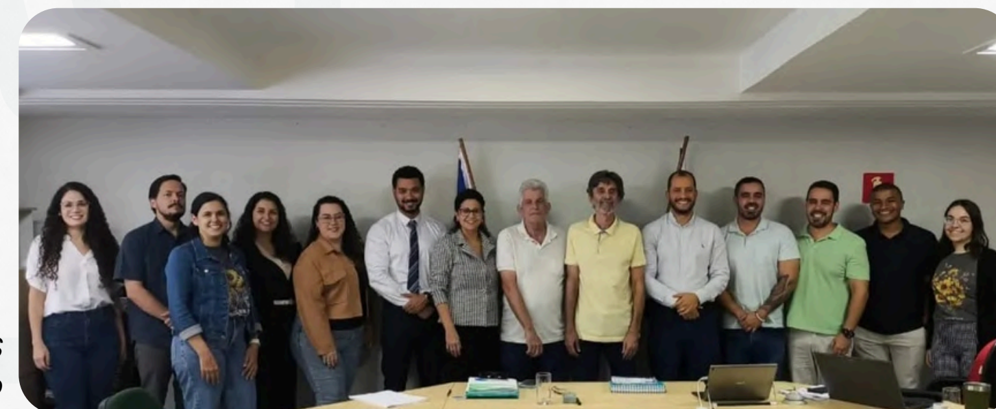
Diretoria Executiva e chefes dos Setores do CRMV-ES reunidos para falar sobre planejamento estratégico